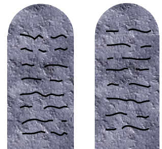
Zeichnung 1 "Das Gesetz"

Vielleicht verstehen wir jetzt klarer, weshalb Paulus in verschiedenen seiner Briefe so eindringlich vor der Gefahr warnt, dass Menschen, die zum Glauben an Jesus Christus gekommen sind, wieder zur Gesetzlichkeit zurückkehren könnten. Sie würden sich mit einem solchen Schritt logischerweise vom befreiten Dienen abwenden und ihr Dienst für Jesus Christus würde unnütz. Der Galaterbrief (z.B. 5,1-4.15 ) spricht diesbezüglich eine klare und ernste Sprache.